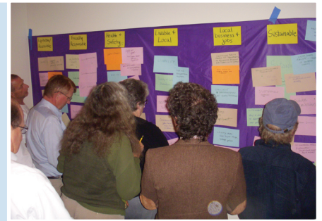
Proyectos del Nivel 1 Proyectos Recomendados por PAC (a finales de abril 2013)